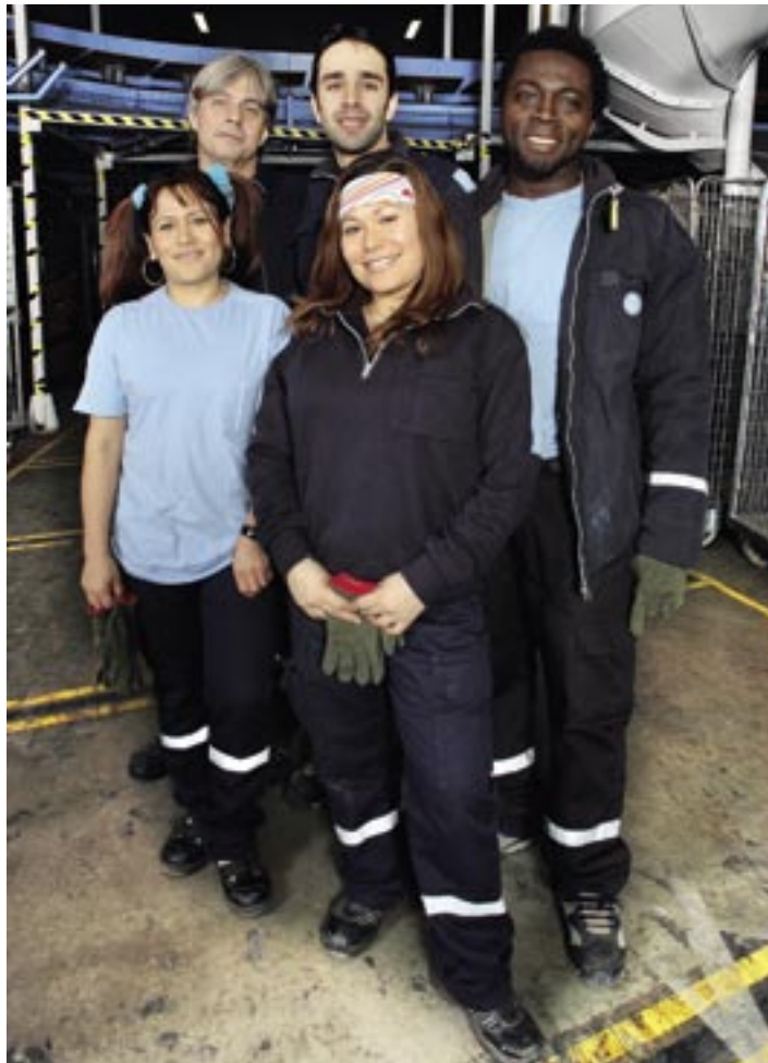
Ett gäng SEKO-medlemmar på Segeltorp-terminalen utanför Stockholm. Här är nästan alla anställda anslutna till SEKO.

– Eftersom många på arbetsplatsen är unga och invandrare så blir klubben även ett stöd i det svenska samhället. Vi hjälper till